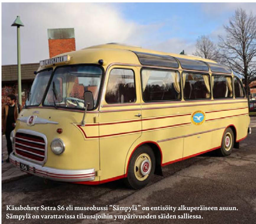
Kässbohrer Setra S6 eli museobussi ”Sämpylä” on entisöity alkuperäiseen asuun. Sämpylä on varattavissa tilausajoihin ympärivuoden säiden salliessa.

Avoinna: ke 9-15, to 13-19, su 10-16 Aleksis Kiven tie 14, Nurmijärvi Pääsymaksu: 5 e / Museokortti