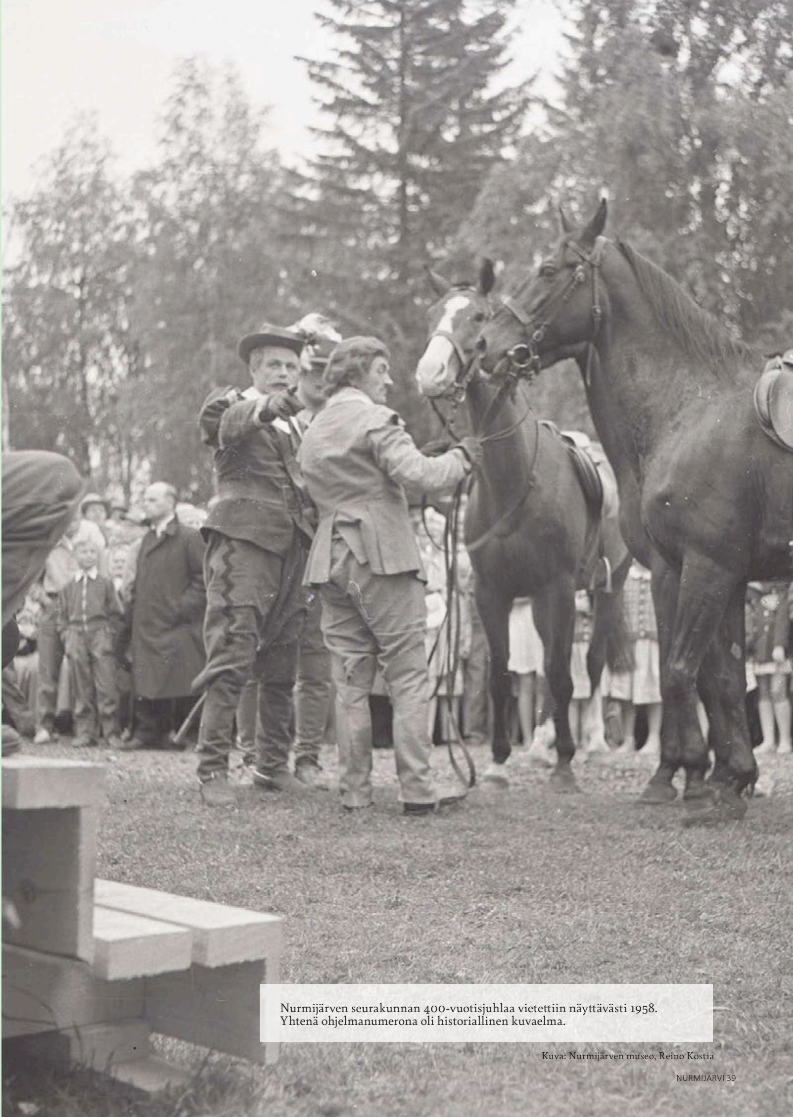
Nurmijärven seurakunnan 400-vuotisjuhlaa vietettiin näyttävästi 1958. Yhtenä ohjelmanumerona oli historiallinen kuvaelma.