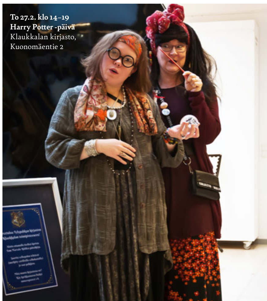
To 27.2. klo 14–19 Harry Potter -päivä Klaukkalan kirjasto, Kuonomäentie 2

Kaikenikäiset Potter-fanit ja velhoiksi haluavat ovat tervetulleita tutustumaan taikakirjaston saloihin. Etsi siis paras kaapusi ja taikasauvasi jo valmiiksi, sillä uudet seikkailut odottavat!