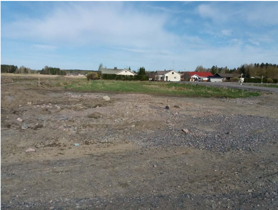
Kuva tontista 3062/4 itään päin (Kuva otettu 6/2018).

Kohteiden asemakaavamerkintä on AP asuinpientalojen korttelialue ja rakennukset saa rakentaa kahteen kerrokseen. Asemakaavaan liittyy sitova rakentamistapaohje.