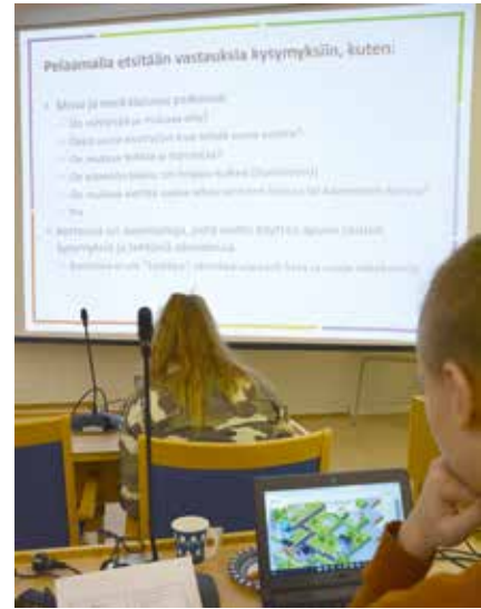
Oppilasagentit työstiivä tammikuussa kouluilaisten osallisuuspelejä. Näin koululaisilta saadaan palautetta palveluverkkosuunnitelman työstämiseen.

Tutoropettajatoimintaan sekä oppilasagenttitoiminnan kehittämiseen Nurmijärven kunta on saanut Opetushallitukselta erityisavustusta. Hankkeet ovat käynnissä lukuvouden loppuun ja tutoropettajatoimintaan on myönnetty jatkorahoitusta myös lukuvuodelle 2020–2021.