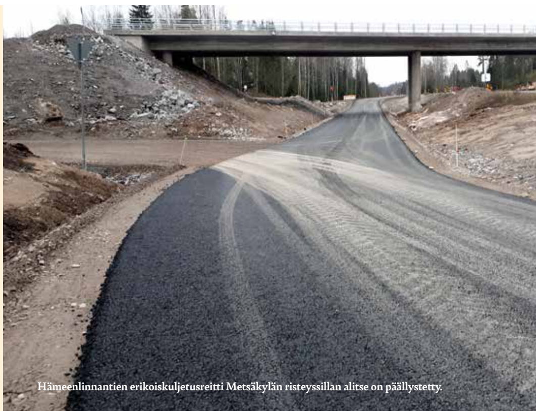
Hämeenlinnantien erikoiskuljetusreitti Metsäkylän risteyssillan alitse on päällystetty.

Tietyöjärjestelyjä on kaikilla ohikulkutien risteävillä teillä.