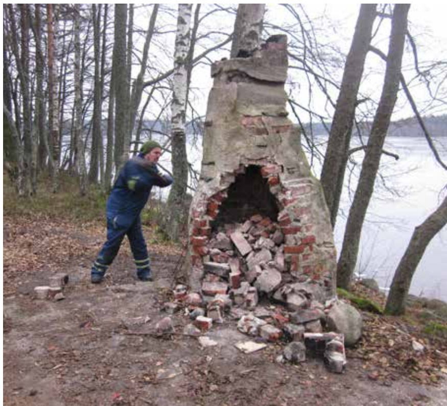
Mustasaaren uusi puolikota ja tulisija sijoittuvat vanhan katoksen paikalle. Näin hyödynnetään vanhan katoksen pohjaa ja vältyttiin maan pinnan rikkomiselta.