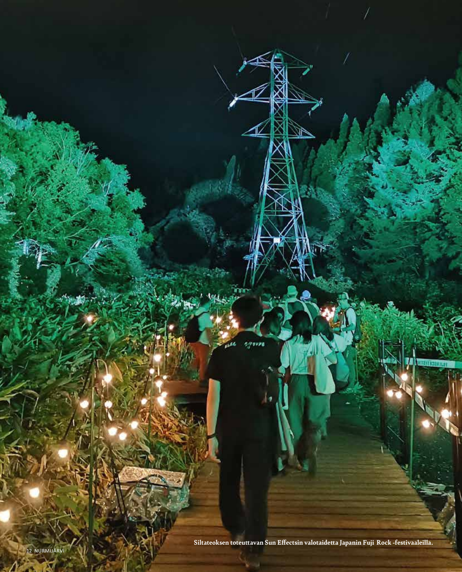
Siltateoksen toteuttavan Sun Effectsin valotaidetta Japanin Fuji Rock -festivaaleilla.