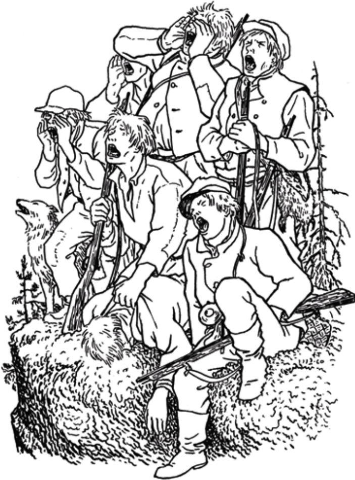
Veljekset hiidenkivellä. Erkki Tantun kuvituskuva Aleksis Kiven Seitsemään veljekseen.

Erkki Tanttulla oli pitkä suhde Aleksis Kiven teoksiin.